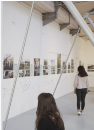
Ausstellung « L'Art des Sentiers Métropolitains » (Pavillon de l'Arsenal, Paris 2020)

Welche Form gibt man den Geschichten und Erzählungen, die der Weg hervor- gebracht hat ?