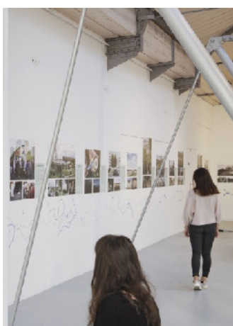
Έκθεση « L'Art des Sentiers Métropolitains » (Pavillon de l'Arsenal 2020)