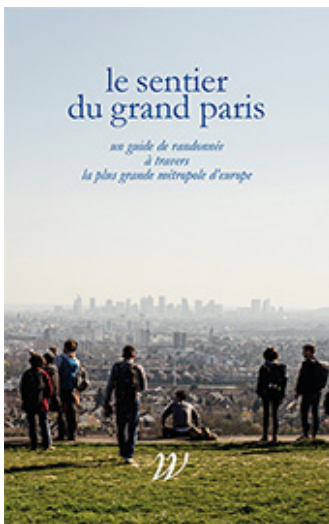
Ο οδηγός του sentier du Grand Paris (Wildproject 2020)