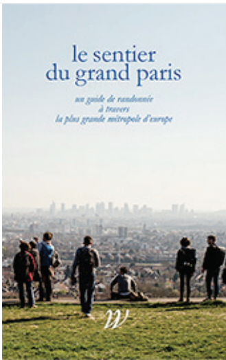
La guía Le sentier du Grand Paris (Wildproject 2020)

Pero, ¿qué formas conviene dar a los relatos que el sendero genera?