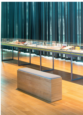
Exposición « L'Art des Sentiers Métropolitains » (Pavillon de l'Arsenal 2020)

Como máximo, podría considerarse una obra la línea del sendero, aunque no todos los creadores de senderos reivindiquen la posición de artista; y cuando lo hacen, muy a menudo lo hacen en nombre de un arte “de esca-