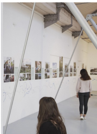
Exposition « L'Art des Sentiers Métropolitains » (Pavillon de l'Arsenal 2020)

À la limite, la ligne du sentier pourrait être considérée comme une œuvre – même si les créateurs de sentiers ne revendiquent pas tous la position d'artiste, et lorsqu'ils le font, c'est souvent au nom d'un art « à faible